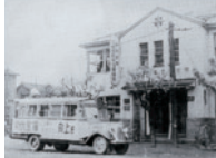
北海道勤労信用組合 (道立札幌労働会館2F)

これもひとえに、これまでに数多くの勤労者の皆様から寄せられたご支援や事業推進のための絶大なるご協力によるものと、あらためて感謝を申し上げる次第です。