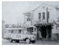
北海道勤労信用組合 (道立札幌労働会館2F)