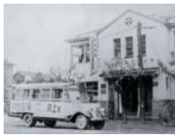
北海道勤労信用組合 (道立札幌労働会館2F)